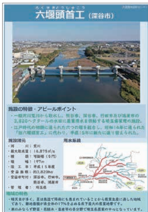
大里農林振興センター作成パネル