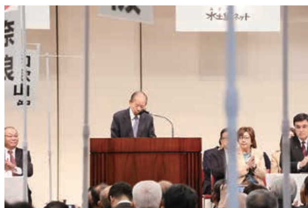
全土連二階会長の挨拶