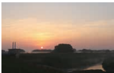
「あさもやの水門」 今井 秀和 (撮影場所：熊谷市)