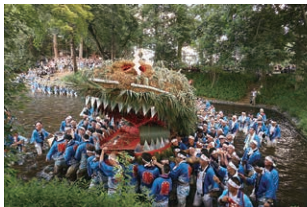
川越土地改良推進協議会会長賞

講評： 農作業が機械化されていくことで、女性も参加しやすくなることは良かったですね。しかも若い人の様ですから各地に後継を期待できる流れになるといいですね。後方に副都心の特徴あるビルを配したことで、題名通りの都市型農業の未来を想像させてくれます。上部の青い空が強めなのが気になりました。