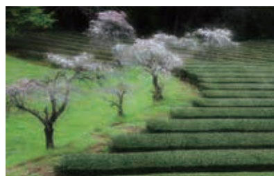
「狭山茶の古里」 水上 貴夫 (撮影場所：入間市)