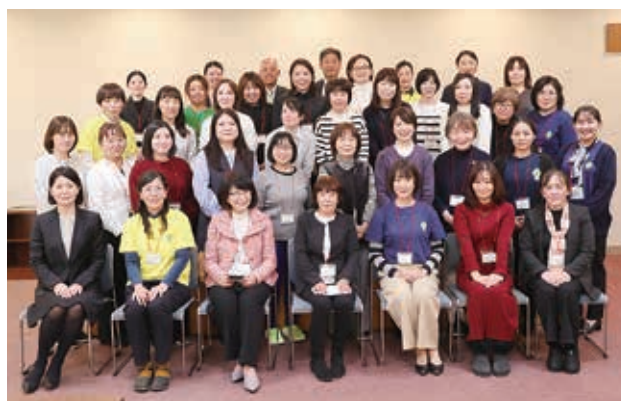
とちぎ水土里ネット女性の会と記念撮影