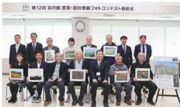
入選・特別賞の皆様

表彰式は令和6年12月10日(火)本会大会議室において開催され、受賞者の方々には表彰状と記念品が授与された。