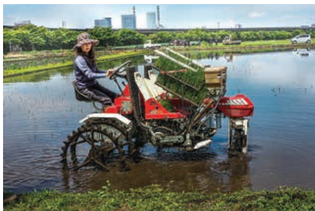
さいたま土地改良推進協議会会長賞

講評： スケールの大きな作品になりました。 広角レンズを上手に使用して広がりや奥行を出すなどかなりの実力です。 空の部分を少なくしたことで、水面に写る青空が強調されました。 手前の緑の草とのバランスも良かったですね。 それぞれの田んぼに引く水路を左に寄せたのも構成上、成功しています。