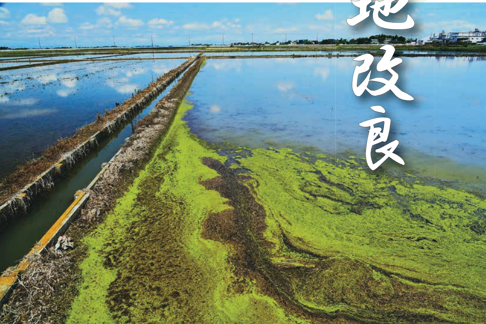
田水張る（久喜市菖蒲町）