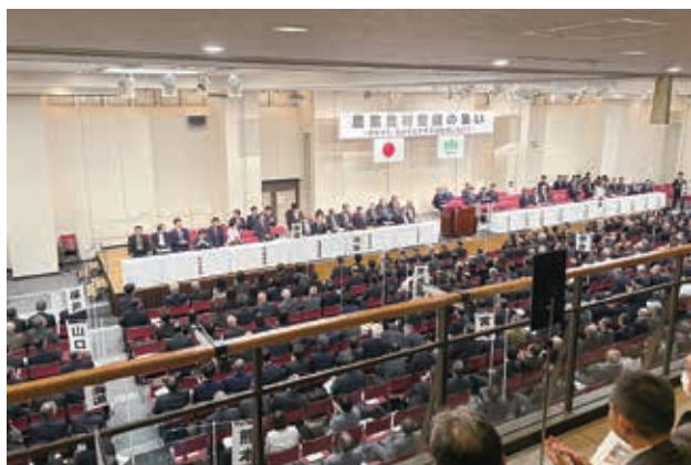
盛大な会場の様子