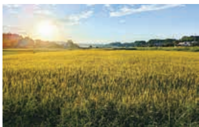
「太陽と田んぼ」 小島伊津樹 (撮影場所：東松山市)