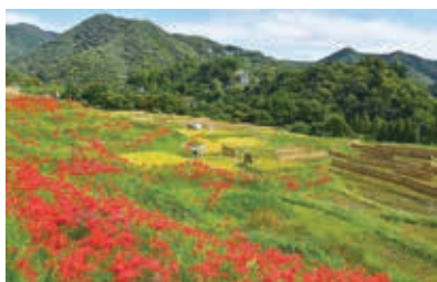
「実りの秋を飾る彼岸花」 丹羽由美子 (撮影場所：横瀬町)