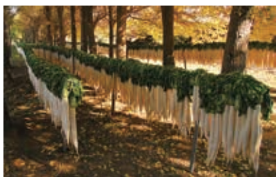
「寒風さらし」 真下 廣義 (撮影場所：深谷市)