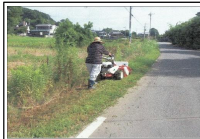
( 農道草刈り作業 )