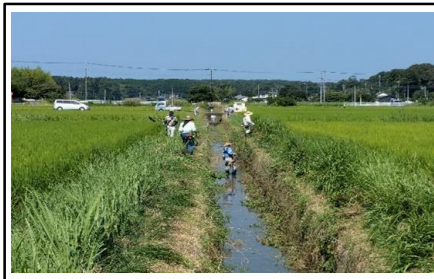
( 水路草刈り作業 )

大岡水土里保全会は、大岡第一土地改良区の受益地を活動範囲とした組織である。 農業者と非農業者により構成される組織であり、主な活動は農地維持活動として水路、農道等の草刈り等を行って来た。 水路の泥上げについては水の流れの少ない2月から3月を予定している。 資源向上活動(長寿命化)においては、水路等の軽微な補修について、直営にて施行していく予定である。