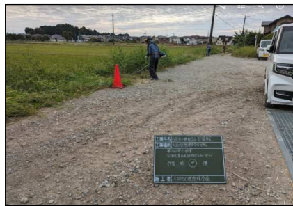
( 草刈り作業 )