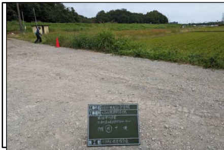
( 草刈り作業 )

当地区は、坂戸市南西部に位置している水田地帯です。 農業の担い手だけでは管理しきれない農地も増え地域全体での保全管理が必要とされています。 構成員による農地維持活動を通じ、森戸市場地区に存する農用地、水路、農道等の地域資源及び農村環境の保全並びに水路・農道等の施設の長寿命化を図った活動をする。